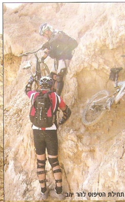
תחילת הטיפוס להר יהב

הגשם מתחדש בליווי סופת ברקים ורעמים עזה מאין כמוהו, ממש כמו הרעשה ארטילרית. הברקים היו נמוכים מאוד ודרך האוהל ראיתי שהאירו את כל הסביבה. הרעמים, שלא איחרו לבוא אחר הברקים, היו כה חזקים עד כי נדמה היה שהכל מתמוטט סביבנו. הגשם לא היה חזק במיוחד במהלך הסופה, אבל בהחלט שמעתי אותו מכה באוהל. גדי ונורקין מזמינים אותי לצ־פייה במופע האור קולי מבעד לחלונות הרכב. אני מוותרת ונכנסת לאוהל. בשלב זה, עלי להו־המשך בעמוד הבא