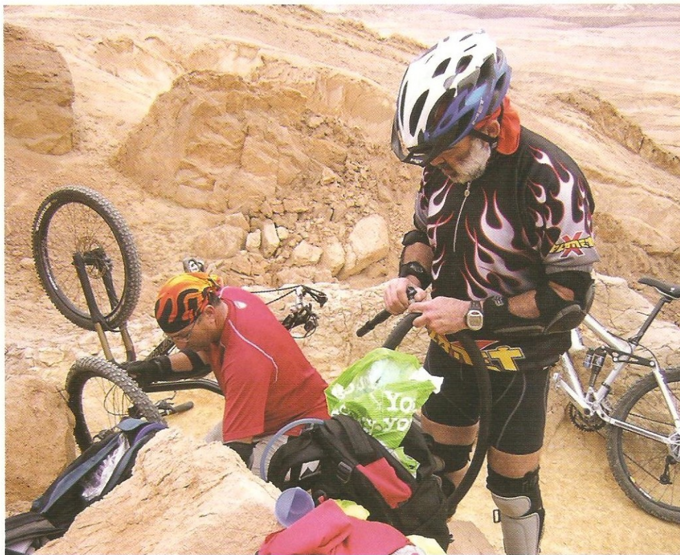
תקלות באמצע הדרך

כשאנחנו כמעט מגיעים לפסגה מופיעים בקושי כמה מהקווים המיוחדים במכשיר הקטן וקליטה רפה חיברה אותנו למחוזות רחוקים. לאחר שעניין זה סודר ואבן גולה מעל לבנו, התפנינו למשימה העיקרית ביותר כוח. המשי-מה: לנפוח את נשמתנו בניסיון לטפס את הר יב. ואכן עמדנו במשימה זאת יפה מאוד והנוף שנגלה לנו מפסגתו באמת נטל את נשמתנו. אבל אחר כך החזיר. משם התחלנו לרכוב מז-רחה בבקעה ששידרה לנו תחושה שאנו רוכבים בארץ לא נודעת ובתולית לגמרי. ואז, לפתע פתאום, גדי מצביע על איזה הר שנישא לפנינו