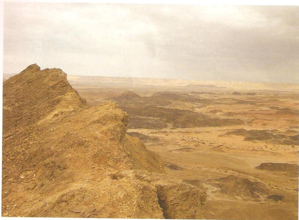
הנוף הנשקף מכרובולת חרירים

(ששמו האמיתי הוא רמת צבירה) ואומר בנוש- לנטיות איומה: "לשם אנחנו מטפסים עכשיו". לא נתתי לו הרבה זמן תגובה, וכאילו יש לי ארבע רגליים, נעמדתי על השתיים האחוריות והבעתי באסרטיביות ראויה לשמה את התנגדותי! סיר- בתי בכל תוקף לעוד עלייה באשר היא. נסינות השכנוע שלו לא הועילו ולבסוף הגענו להסכמה על רכיבה בערוץ הנחל עד לתחנת הדלק שב- כביש הערבה, שם חיכו לנו דויד ודירי.