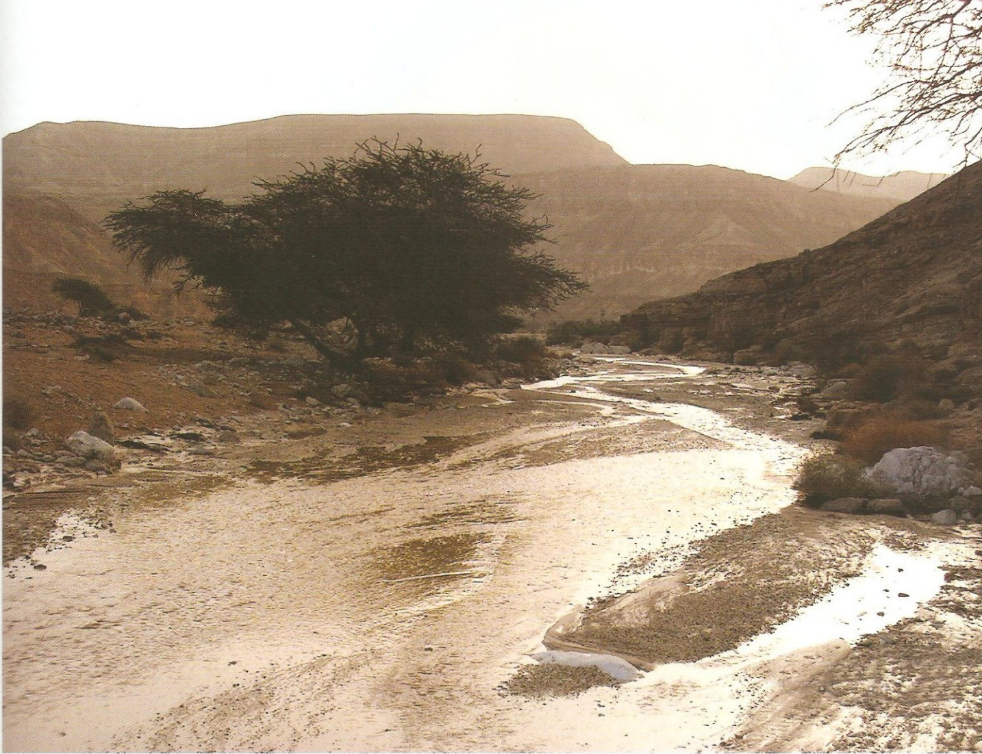
הבוקר שאחרי. המדבר זורם